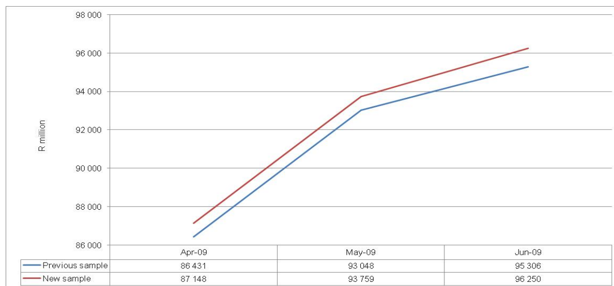
Figure A – Total value of sales of manufactured products: monthly levels of previous and new sample April to June 2009